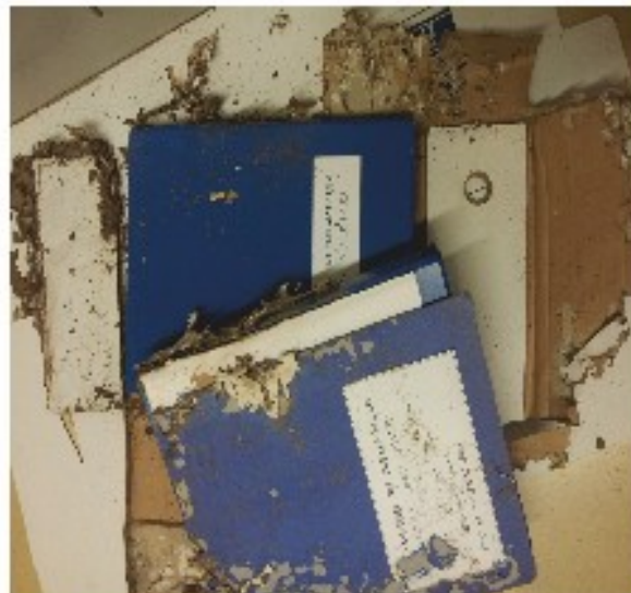
Capsa i expedients menjats