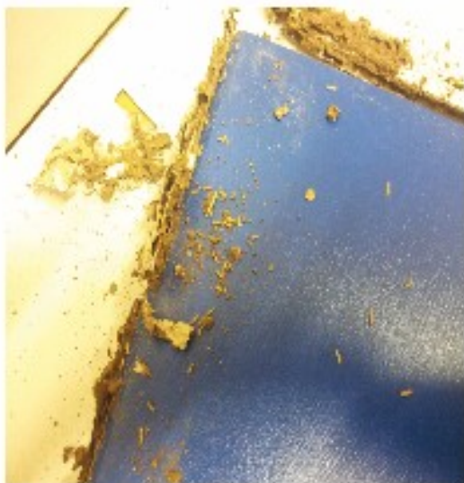
Restes d'insectes, anèl·lids i/o coleòpters