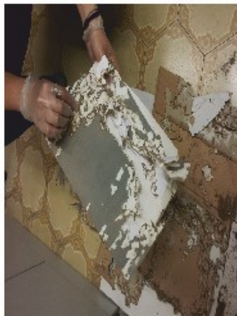
Expedient afectat per insectes, anèl·lids i/o coleòpters