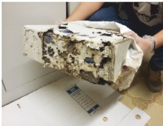
Capsa menjada per insectes